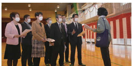
令和3年4月5日市内小学校の体育館エアコン設置状況を視察

私の公約の一つであった市内小中学校体育館へのエアコン設置について、国会議員と地方議員の公明党のネットワーク力を活かし実現。